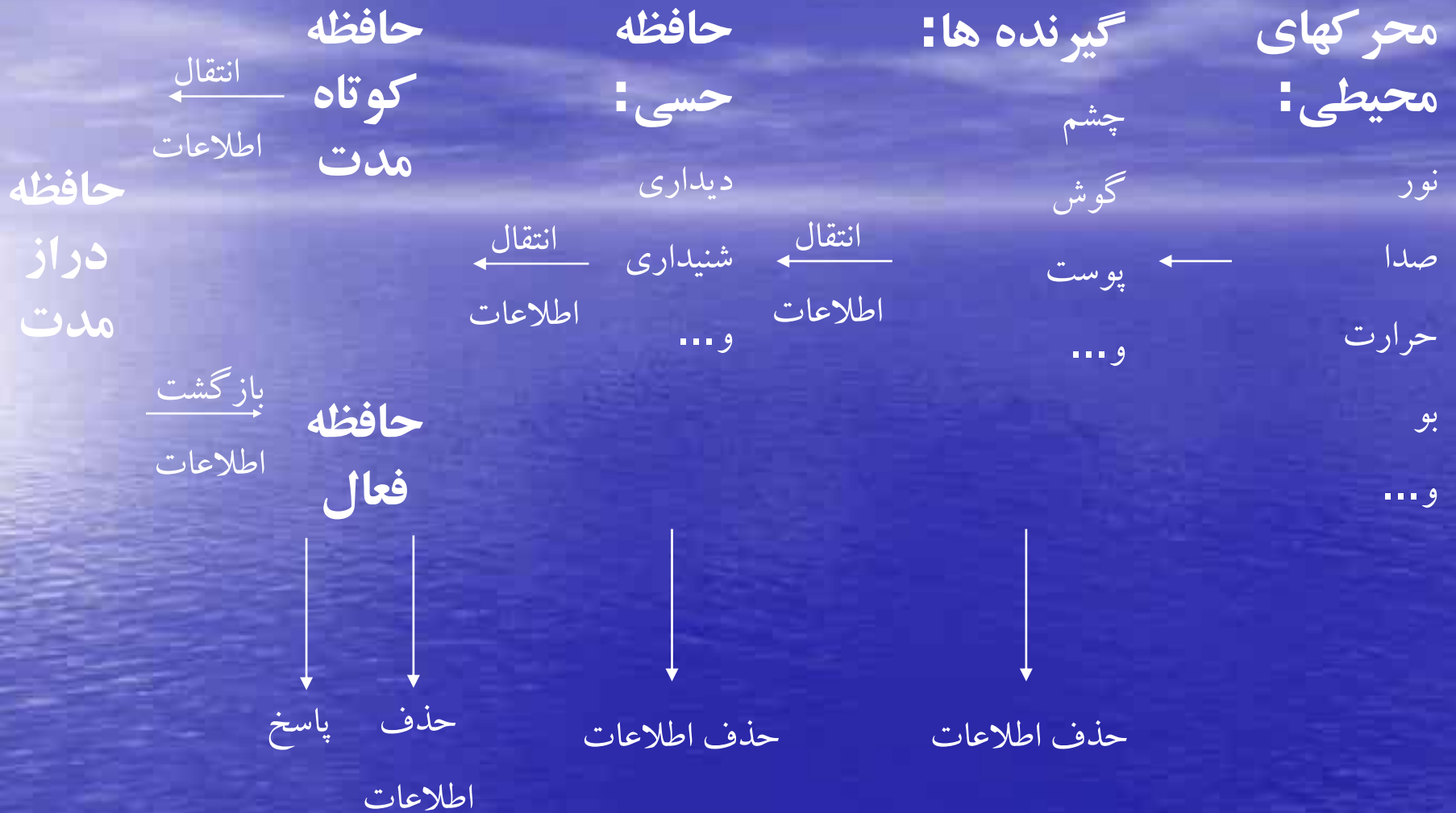
شکل ۱-۸. فرایندهای یادگیری و به یاد سپاری: مدل خبرپردازی یادگیری